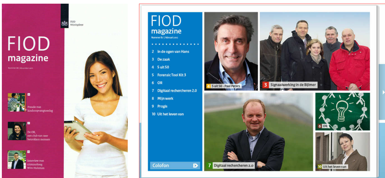
Links het laatste magazine in druk en rechts het nieuwe digitale gezicht

Oud-collega's van de FIOD die belangstelling hebben om op de hoogte te blijven van het actuele wel en wee bij de dienst kunnen een e-mail sturen aan fiod.redactie@belastingdienst.nl .