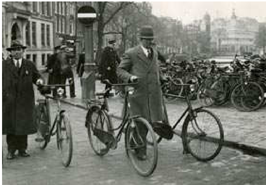
Ambtenaren van de Belastingdienst en Gemeentepolitie voeren in beslag genomen fietsen af na controle Rijwielbelasting.

Reeds stond Breda op de zwarte lijst voor wat betreft soepelheid bij het controleren der rijwielbelastingmerken. Zoo werden gisteren bij een controle ettelijke wielrijders verbaliseert, die het plaatje wel bij zich hadden, doch dit niet op de voorgescreven wijze zichtbaar droegen. Het toppunt was echter in Chaam te zien, waar een rijksambtenaar iemand twee kwartjes liet betalen, omdat het plaatje niet op het stuur bevestigd was. De man had n.l. om diefstal te voorkomen het plaatje bevestigd in den beugel van zijn bel. Hoewel de man overtuigd was dat hij door de kantonrechter zou worden vrijgesproken, trof hij toch een schikking van 50 cent omdat de kosten van het bijwonen van de zitting in Breda hem meer zou kosten aan reiskosten en arbeidverzuim. Ook werd een dienstmeisje te Breda, die het plaatje goed zichtbaar op haar mantel droeg, tot twee maal toe naar het politiebureau gebracht omdat het plaatje er zoo oud uitzag dat men vermoedde dat het vervalscht was. Beide keren werd het meisje wel een kwartier lang ondervraagd”. →